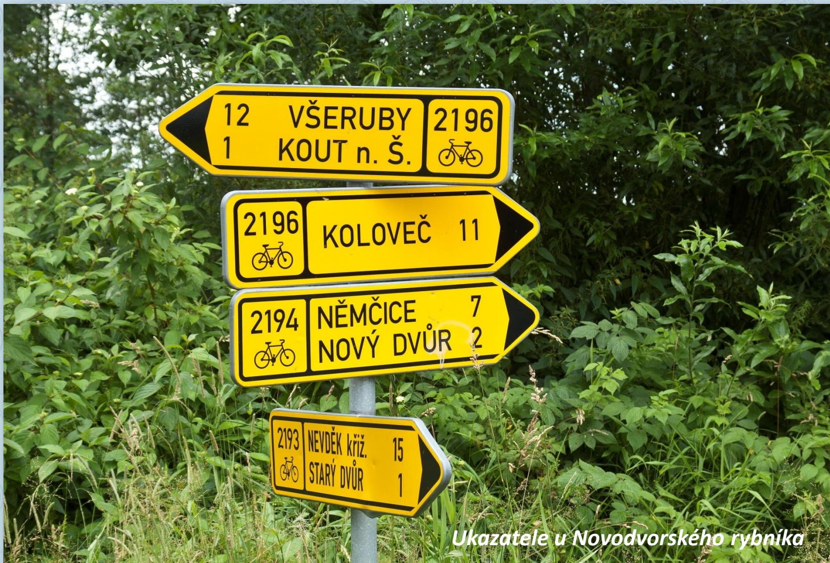
Ukazatele u Novodvorského rybníka