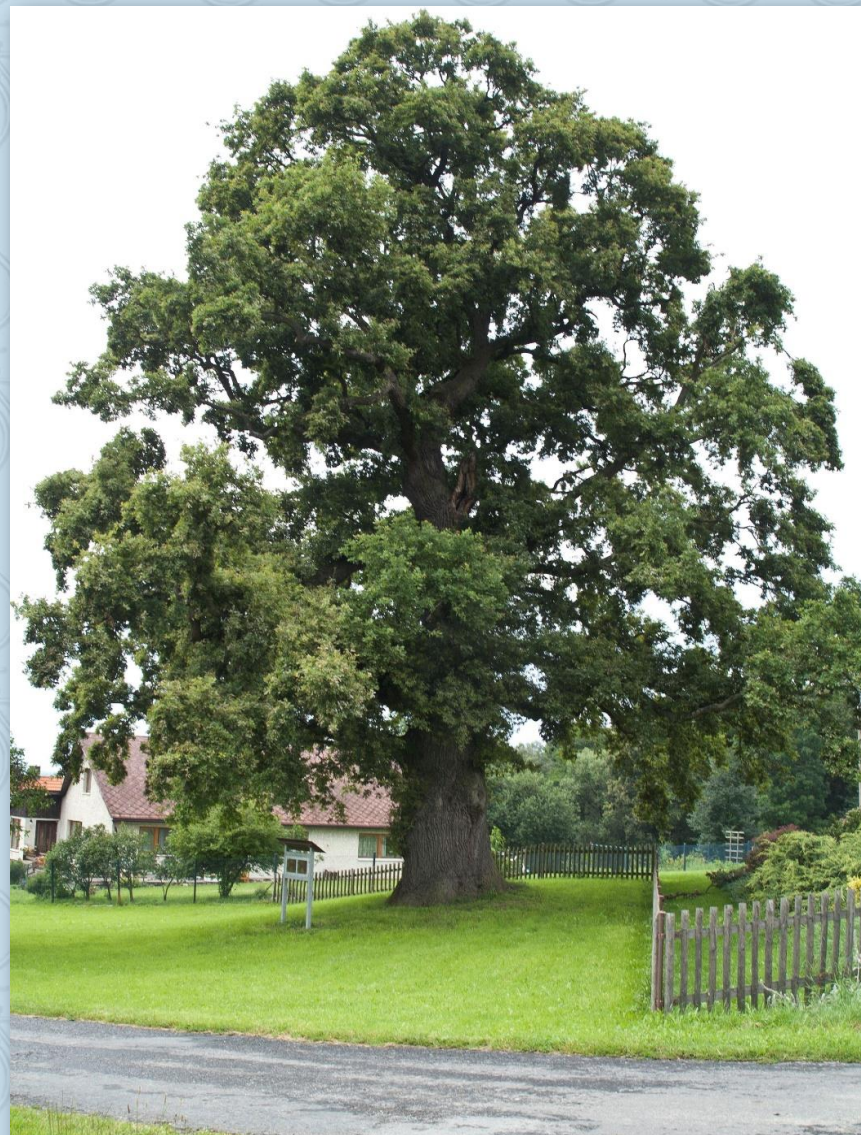
Památný strom ve Starém Dvoře

V obci Podzámčí si uděláme krátkou odbočku doprava a podíváme se na hrad Rýzmberk. Rozhled z věže hradu stojí za to. Pokračovat budeme po trase č. 2193, směr na Nevděk. Pokračujeme dál, až na křižovatku, kde se dáme vlevo, po hlavní silnici a vzápětí na další křižovatce doprava. Za zatáčkou následuje odbočka na vrchol Korábu, takže kdo chce, může se vyšplhat na vrchol. Vráť se pak stejnou cestou na původní trasu. Pokračujeme po ní dál a asi po 150 m odbočíme doprava směrem na Modlín a po stále stejné trase č. 2193 až do obce Nová Víska. Přejedeme opatrně silnici I. tř. Klatovy – Domažlice a po modré turistické trase projedeme údolím a ocitneme se v Dlažově, kde se dáme doprava. Přes Miletice se dostaneme do Běhařova. Hned na kraji vsi, jen co mineme rybník po pravé straně, odbočíme doleva. Jedeme dolů, na křižovatce vlevo a na další vpravo a přes Úborsko, po cyklotrase č. 2052 pokračujeme až do Nýrska.